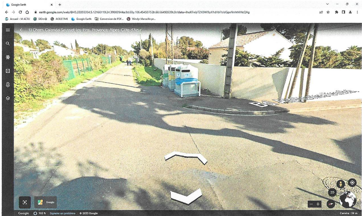
Devant PAV chemin calendal en haut boulevard Alphonse Daudet