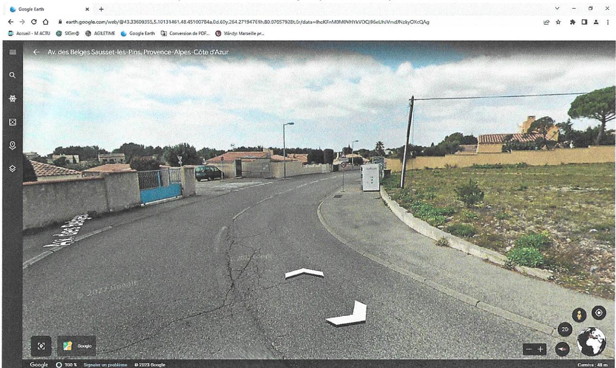
Avenue des belges grand trottoir devant à côté du PAV