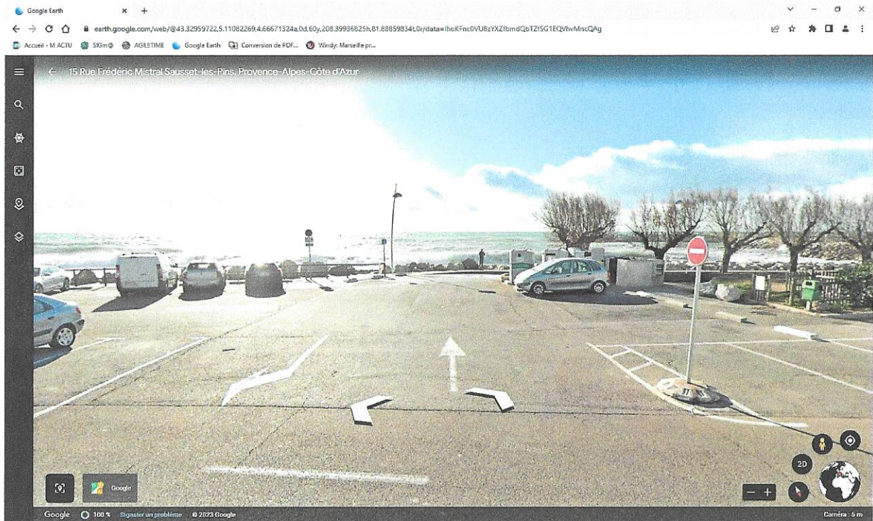
Parking des girelles a la place de la voiture grise