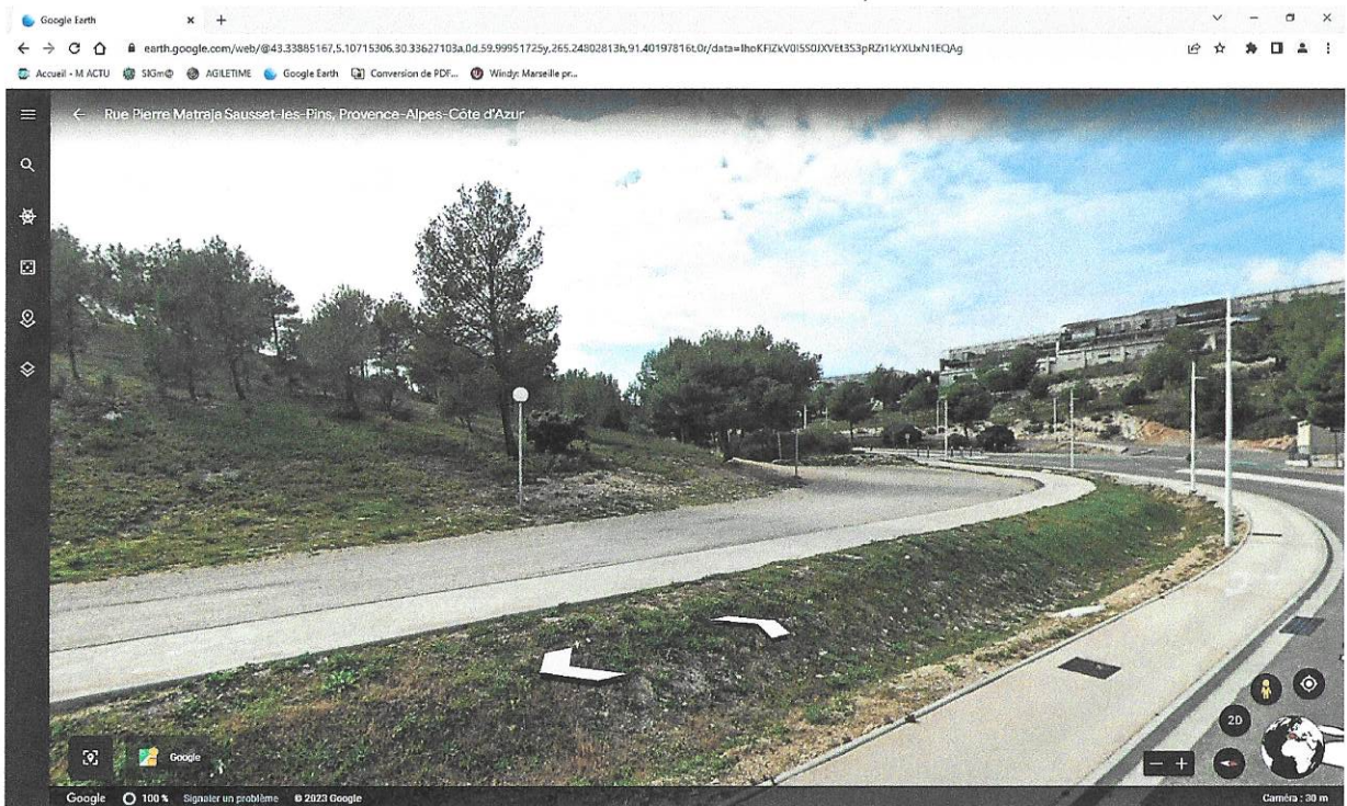
parcours naturel sur la parking en terre