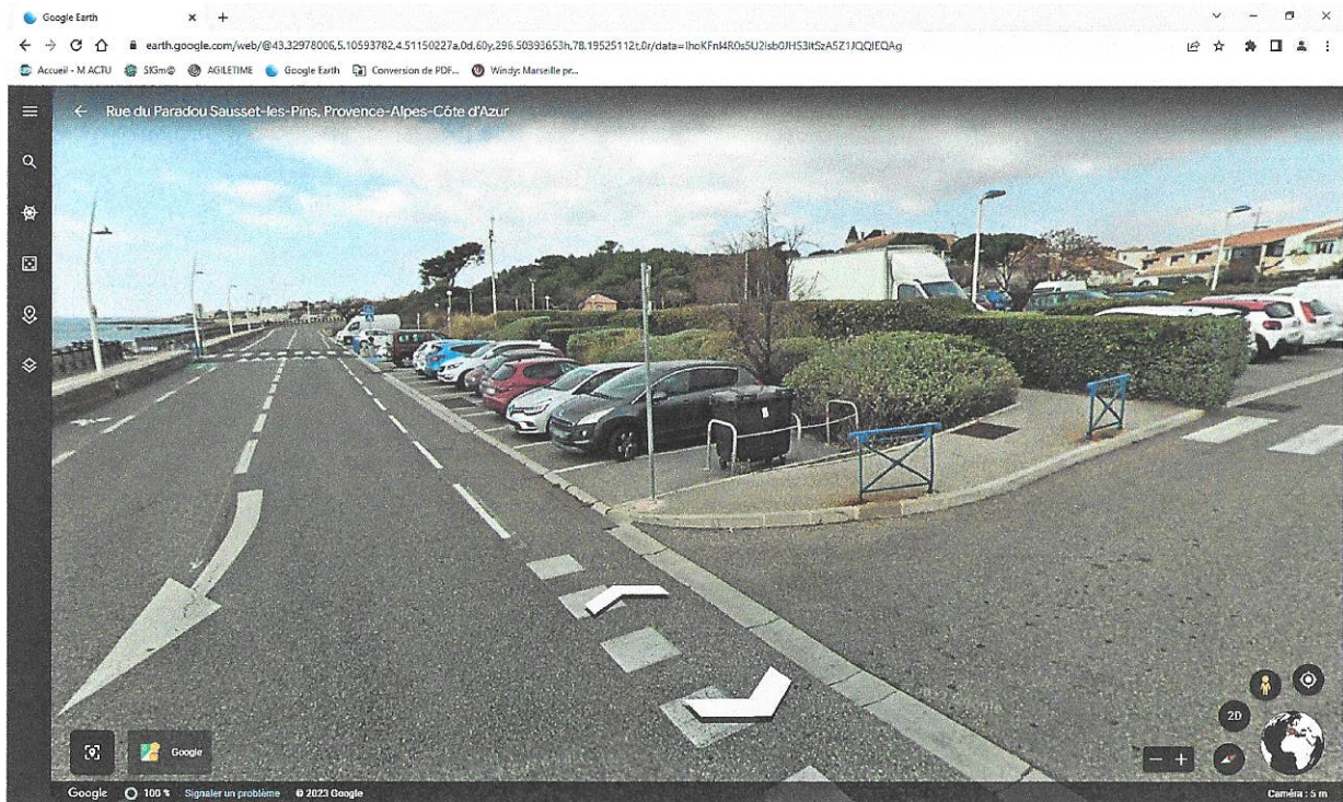
Benne paradou corniche e jacques Chirac près des containers